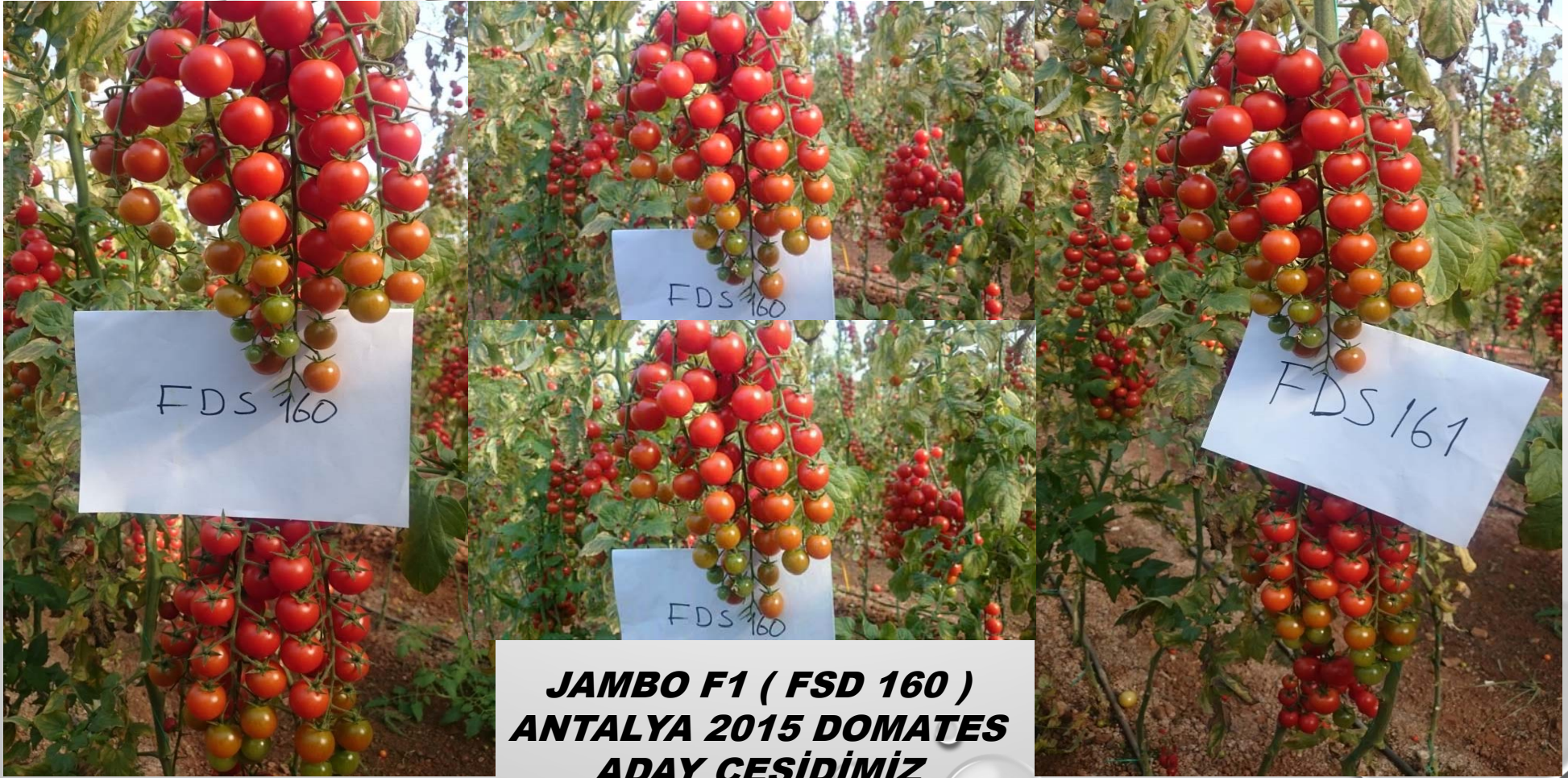
JAMBO F1 ( FSD 160 ) ANTALYA 2015 DOMATES ADAY ÇEŞİDİMİZ